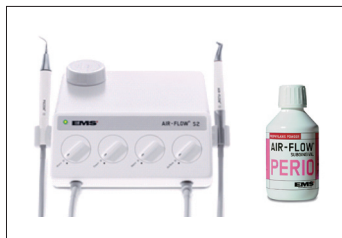
▲筆者から寄せられた原稿の画像